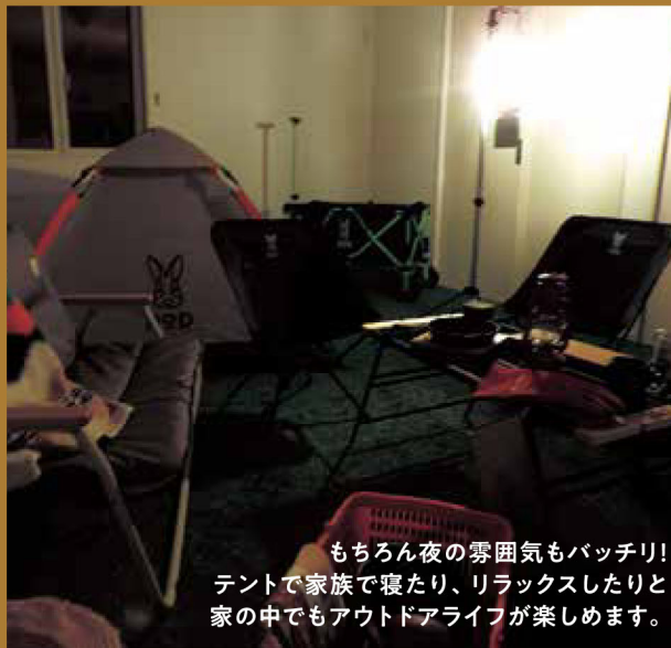
もちろん夜の雰囲気もバッチリ! テントで家族で寝たり、リラックスしたりと 家の中でもアウトドアライフが楽しめます。