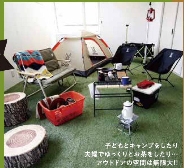
子どもとキャンプをしたり 夫婦でゆっくりとお茶をしたり… アウトドアの空間は無限大!!

「キャンプに行きたい!けどなかなか行けない…」 「せっかく揃えたアウトドア用品をキャンプの時しか 使わないなんてもったいない!」 家でも活躍してくれるアウトドア用品を使った インドアキャンプの企画を開催します!