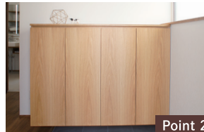
Point 2 旭川の家具メーカー ガーjourカームワークスさんに制作してもらったシューズBOX