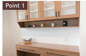
Point 1 キッチンに雰囲気合わせた造作のカップボード