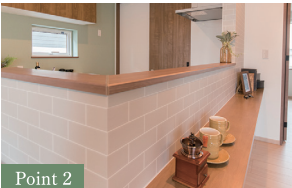
Point 2 ポイント使いのタイルシートがモダンさを引き立たせる