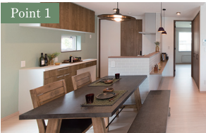
Point 1 白と木目で統一された、スッキリとしたキッチン