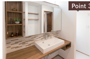
Point 3 3面鏡と造作収納で作り上げた洗面台 タイルの雰囲気グステキ